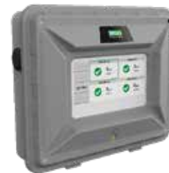
Pantalla remota Chillgard 5000