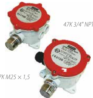
47K 3/4" NPT