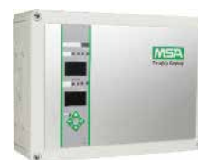
9020 SIL de montaje en pared